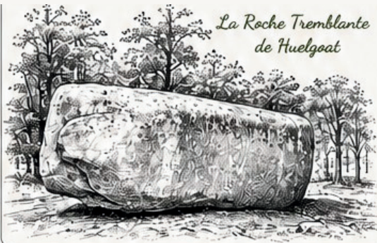
La Roche Tremblante de Huelgoat

REPAS DU SAMEDI SOIR SUR RESERVATION PLACES LIMITÉES